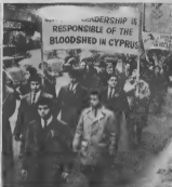
Irregularidadnan na Cyprus: Na robes Arzobispo Makarios, president di Cyprus, ta lezando un nota den cual e ta pidi e Cypriotanan Turco y esnan Griego pa stop cu bringamento. Na banda drechi Cypriotanan Turco demostrando na London.